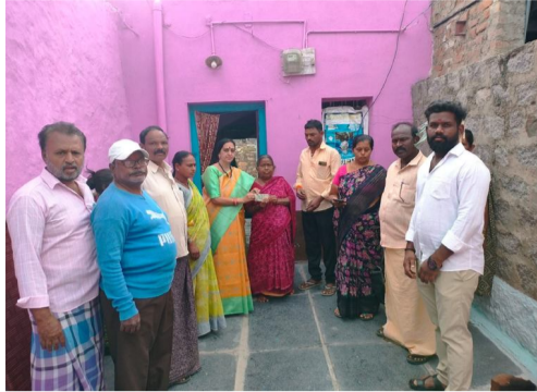
నేరుగా పెన్షన్లను అందజేశారు. ఒకటో తేదీ ఉదయాన్నే తమ

తుగ్గలి జూన్ 01 (వార్త పత్రిక):- రాష్ట్ర ముఖ్యమంత్రి నారా చంద్రబాబు నాయుడు ఆధ్వర్యంలోని కూటమి ప్రభుత్వం అత్యంత ప్రతిష్టాత్మకంగా చేపట్టిన ఎస్టిఆర్ భరోసా పెన్షన్ల పంపిణీ కార్యక్రమం తుగ్గలి లో పండుగ వాతావరణంలో జరిగింది. ప్రతి నెలా ఒకటో తేదీనే లబ్ధిదారులకు క్రమం తప్పకుండా పెన్షన్లు అందించాలనే ప్రభుత్వ ఆశయానికి అనుగుణంగా, జూన్ 1వ తేదీ ఉదయాన్నే సచివాలయ ఉద్యోగులు, కూటమి నాయకులు పంపిణీ కార్యక్రమాన్ని ప్రారంభించారు. ఎమ్మెల్యే కే, శ్యాం బాబు ఆదేశాల మేరకు తుగ్గలిలో మాజీ జెడ్పీటీసీ కే, వరలక్ష్మి లబ్ధిదారుల ఇళ్లకు వెళ్లి