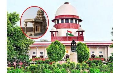
కోర్టు తీర్పుతో వారందరి ప్రయత్నాలకు బ్రేకులు వచ్చాయి. పశ్చిమగోదావరి జిల్లా ఆకివీడు పునరుద్ధారణానికి రామాలయాన్ని నిర్మించాలని డిఫ్యూటీ స్పీకర్ రఘురామ కృష్ణరాజు శంకుస్థాపన కూడా చేశారు. రామాలయం నిర్మాణం పూర్తి చేసి తీరుతామని, కోర్టువేళ్లను కేసులు వేసినా ఈ విషయంలో వెనక్కి తగ్గే తప్పే లేదని చెప్పారు. రెండు వారాల క్రితం దాఖలైన పిటిషన్లను కోర్టుయదంతో రామాలయం నిర్మాణానికి గ్రీన్ సిగ్నల్ ఇచ్చింది.