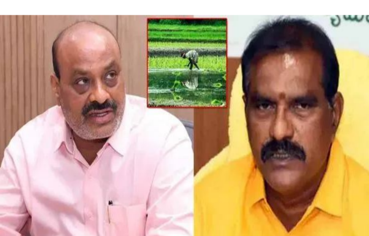
ప్రకటించారు. కృష్ణా దెబ్బాకు జూన్ 1 నుంచి, నాగార్జున సాగర్ ఆయకట్టుకు జూన్ చివరికి, కె.సి. కెనాల్కు జూన్ 15 నుంచి, వంశధార