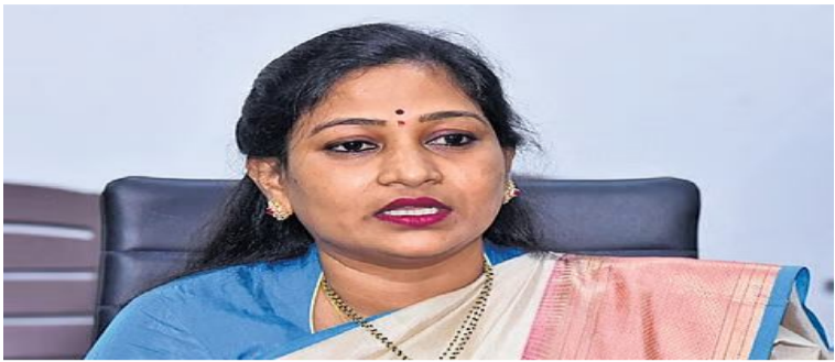
తిరుపతి, మే 18:

తిరుపతిలోని స్పెషల్ సబ్ జైల్స్ రాష్ట్ర హోం మంత్రి వంగలపూడి అనిత ఆకస్మికంగా తనిఖీలు నిర్వహించారు. (సోమవారం) ఉదయం సబ్ జైల్స్ వెళ్లి మంత్రి.. జైల్లో ఖైదీలకు కల్పిస్తున్న వసతులను గురించి జైల్ అధికారులను అడిగి తెలుసుకున్నారు. అనంతరం హోం మంత్రి మాట్లాడుతూ.. జైల్లో సత్వరపరమ తీసుకురావడం కోసం జైల్ అని చెబుకోవచ్చు. తిరుపతిలోని స్పెషల్ సబ్ జైల్ విస్తరణ తక్కువగా ఉంది. ఖైదీల సంఖ్య 120 ఉండాలి. 140 మంది ఉన్నట్లుగా తెలిసిందన్నారు. సబ్ జైల్ ప్రస్తుత విస్తరణ 70 సెంటుగా ఉన్నట్లు జైలు అధికారులు చెప్పారన్నారు. దీన్ని పెంచాలి. తర మరోచోట నిర్మాణం చేయాలి అనేది పరిశీలి