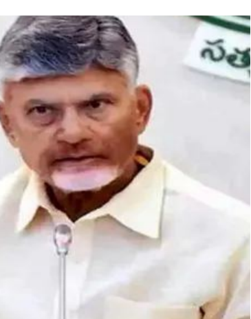
తిరుమల పర్యావరణ పరిరక్షణలో టీటీడీ చేస్తున్న కృషి అమోఘమని ప్రశంసించారు. శేషాచలం అటవీ సంపద కాపాడటంలో టీటీడీ నిరంతర చర్యలు కొనసాగాలని సీఎం చంద్రబాబు ఆకాంక్షించారు.

అమరావతి, మే 18 : తిరుమలలో 89.4 శాతం అటవీ విస్తీర్ణం సాధించిన తిరుమల తిరుపతి దేవస్థానానికి ఆంధ్రప్రదేశ్ ముఖ్యమంత్రి నారా చంద్రబాబు నాయుడు అభినందనలు తెలిపారు. శేషాచలం అడవుల్లో స్థానిక జాతుల పునరుద్ధరణకు టీటీడీ కృషి చేస్తోందని చెప్పుకొచ్చారు. అటవీ సంపద పరిరక్షణకు చేపట్టిన చర్యలు ప్రశంసనీయమని పేర్కొన్నారు. ప్రకృతిని పవిత్రంగా భావించడం భారతీయ సంప్రదాయమని తెలిపారు. ఈ మేరకు సోషల్ మీడియా ఎక్స్ ప్లెట్ ద్వారా పోస్టు పెట్టారు. అడవులు, వన్యప్రాణుల సంరక్షణ దైవసేవతో సమానమని సీఎం చంద్రబాబు వ్యాఖ్యానించారు. భవిష్యత్తు తరాలకు పచ్చని, ఆరోగ్యకరమైన తిరుమల అందించాలనే లక్ష్యంతో టీటీడీ చర్యలు చేపట్టినది తెలిపారు.