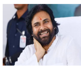
అమరావతి, మే 18 : ఆంధ్రప్రదేశ్ ఉప ముఖ్యమంత్రి పవన్ కల్యాణ్ కేరళం కొత్త ప్రభుత్వానికి శుభాకాంక్షలు తెలిపారు. కేరళం ముఖ్యమంత్రిగా ప్రమాణ స్వీకారం చేసిన పీడి సతీశ్ కుమార్ దయాపూర్వక అభినందనలు తెలిపారు. అలాగే మంత్రులుగా ప్రమాణ స్వీకారం చేసిన వారందరికీ శుభాకాంక్షలు చెప్పారు. ఈ మేరకు సోషల్ మీడియా ఎక్స్ ప్లెట్ ద్వారా పవన్ కల్యాణ్ పోస్టు పెట్టారు. కేరళం నూతన ప్రభుత్వం ప్రజల ఆకాంక్షలను వెరవేర్చాలని పవన్ కల్యాణ్ ఆకాంక్షించారు. సారధ్యకమైన, ప్రగతిశీలమైన పాలనను అందిస్తూ కేరళం రాష్ట్రాన్ని మరింత అభివృద్ధి దిశగా తీసుకెళ్లాలని పేర్కొన్నారు. దేవుని సొంత దేశంగా పేరుగాంచిన కేరళం మరింత అభివృద్ధి, సుసంపన్నత సాధించాలని పవన్ కల్యాణ్ ఆకాంక్షించారు.