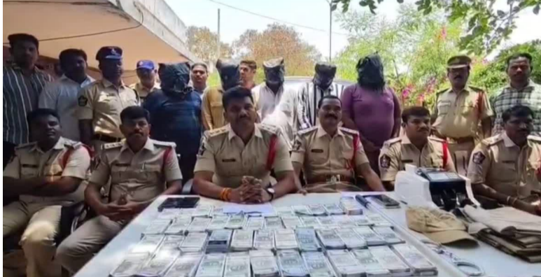
తనిఖీలు చేపట్టినట్లు పోలీసులు వివరించారు. పోలీస్ వేషంలో డబుల్ మనీ మోసం - ఐదుగురు కేటుగాళ్ల అరెస్టు సీక్రెట్ డీల్ పేరుతో పల: పోలీసుల విచారణలో

సత్యసాయి జిల్లా : లక్ష ఇన్చీ పది లక్షలు ఇస్తామని అమాయకులను మోసం చేస్తున్న ముఠాను సత్యసాయి జిల్లా లోపాకి పోలీసులు అరెస్టు చేశారు. పోలీస్ యూనిట్లో వేసుకుని నడిస్తూ సీక్రెట్ డీల్ పేరుతో డబుల్ మనీ సామ్లకు పాల్పడుతున్న ఐదుగురు నిందితులనుంచి రూ.50 లక్షల విలువైన టాచ్ కరెన్సీ, కార్డింగ్ మెషిన్, కారు స్వాధీనం చేసుకున్నారు. ప్రస్తుతం నిందితులు పోలీసుల వేషంలోనే మోసాలకు పాల్పడిన ఈ ఘటన జిల్లా వ్యాప్తంగా కలకలం రేపుతోంది. లక్ష రూపాయలు ఇస్తే పది లక్షలు ఇస్తామంటూ అమాయకులను టార్గెట్ చేసిన మోసగాళ్ల ముఠాను లోపాకి పోలీసులు అరెస్టులోకి తీసుకున్నారు. కొందరూ రోడ్లలో వాహన తనిఖీలు నిర్వహిస్తుండగా అనుమానాస్పదంగా వెళ్తున్న కారును అపి తనిఖీ చేయగా భారీగా టాచ్ కరెన్సీ బయటపడింది. అయితే పక్కా సమాచారంతోనే