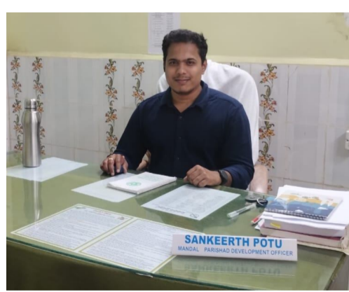
కార్యక్రమం ప్రధాన ఉద్దేశ్యమని అధికారులు తెలిపారు. మండలంలోని యువత, విద్యార్థులు, క్రీడాకారులు,