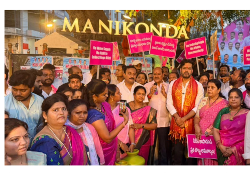
లేదని నాలుగు సార్లు గెలిచినవారంలో నాలుగు రోజులు మణికోండలో నిలిచే పరిస్థితి లేదని హైదరాబాద్ నడిబొడ్డున