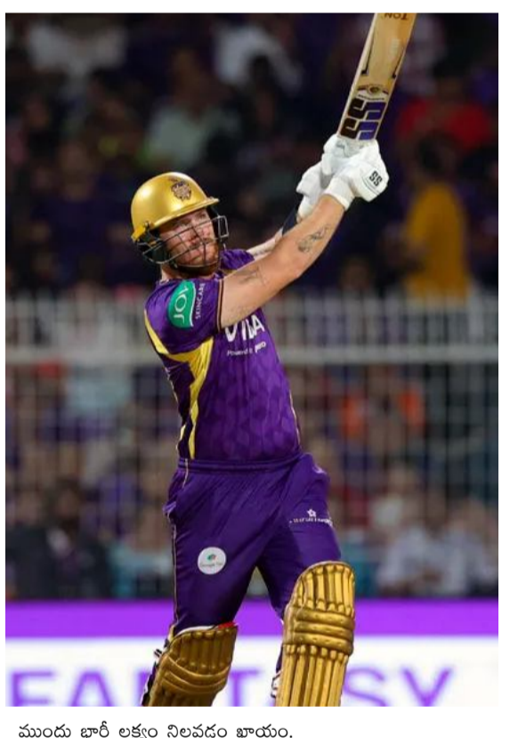
ముందు భారీ లక్ష్యం నిలవడం ఖాయం.