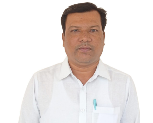
వెకేషన్ డిపార్ట్మెంట్ పరిధిలోకి వస్తున్నందున వీరికి వేరే

డిపార్ట్మెంట్ లో పనిచేసే ఉద్యోగులకు ఇచ్చే విధంగా 24 అదనపు సంపాదిత సెలవులు ఇవ్వాలి. కానీ సమూర్ వెకేషన్ లో తెలంగాణ విద్యాశాఖ ఉపాధ్యాయులను బడిబాట పేరుతో విధులకు హాజరవుతున్న సర్కులర్ జారీ చేయడం ఎంతవరకు సమంజసం, విద్యాశాఖ అధికారులకు ఉపాధ్యాయులు వెకేషన్ డిపార్ట్మెంట్ లోకి వస్తారా లేదా నాన్ వెకేషన్ డిపార్ట్మెంట్ లోకి వస్తారా అనే అవగాహన లేకపోవడం విచారకరం. దీనిపై రాష్ట్ర విద్యాశాఖ అధికారులు సృష్టత ఇవ్వాలి అవసరం ఉంది. సమూర్ వెకేషన్ లో ఉపాధ్యాయులు వారి యొక్క వ్యక్తిగత అవసరాలకు టూల్స్, పనులు పెట్టుకొని ఉంటారు. కానీ ఈ విధంగా బడిబాట కార్యక్రమానికి హాజరవ్వాలని విద్యాశాఖ అధికారులు సర్కులర్ జారీ చేసి ఉపాధ్యాయులను ఇబ్బందుల గురి చేయడం సరైనది కాదని, బడిబాట కార్యక్రమంలో పాల్గొంటున్న ఉపాధ్యాయులందరికీ సంపాదిత సెలవులు మంజూరి చేయాలని వారు డిమాండ్ చేశారు.