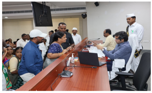
చేయాలని ఆదేశించారు. సర్వే నిర్వహణకు అవసరమైన ఎన్యూమరేటర్ కిట్లు ఇప్పటికే అందుబాటులో ఉన్నాయని, అవసరమైతే అదనంగా మరిన్ని ఏర్పాటు చేస్తామని