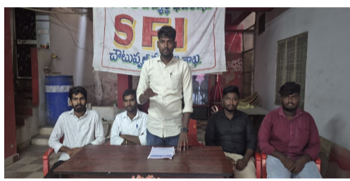
ఫీజులను రాష్ట్ర ప్రభుత్వం చెల్లించే విధంగా ఆదేశాలు ఇవ్వకుండా విద్యార్థుల నుంచి వసూలు చేసుకోవాలనే తీర్పు రావడం చాలా బాధాకరం ఉందన్నారు. ఇప్పటికే ప్రభుత్వ ప్రైవేటు కళాశాలలకు ఫీజు బకాయిలు చెల్లించకపోవడం వల్ల విద్యార్థులకు కళాశాలలు ఎటువంటి ద్రువపత్రాలను అందించడం లేదని ఆవేదన వ్యక్తం చేశారు. ఫీజు చెల్లింపుల