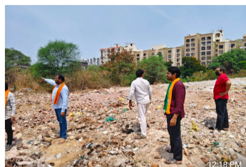
ద్రువపత్రాల ఆధారంగా ప్రభుత్వ భూమిలో కమర్షియల్ షాపులు నిర్మించి అద్దెల రూపంలో లక్షల రూపాయలు వసూలు చేస్తున్నారని ఆరోపించారు. లావాణ్య పట్టా భూములు స్వాతంత్ర్య సమరయోధులు, సైనికులకు గౌరవ సూచకంగా ఇచ్చినవని, అలాంటి భూముల్లో అక్రమ నిర్మాణాలు జరగడం దురదృష్టకరమని అన్నారు. గతంలో ఇదే ప్రాంతంలో డ్రైవ్-ఇన్ హోటల్ నిర్మాణాన్ని మున్సిపల్ అధికారులు కూల్చేసినా, మల్టీ పునర్నిర్మాణానికి సహకరించడం విచారకరమని పేర్కొన్నారు.