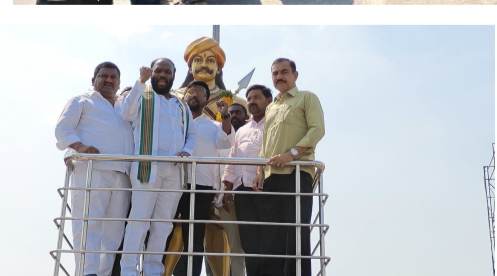
కొనసాగించాలని అన్నారు. చదువుకున్న యువత సమాజ అభివృద్ధికి కీలకమని, వారు ముందుకు వస్తుండటం