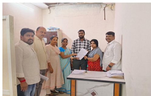
ప్రజా అవసరాల కోసం మినీ స్టేడియం నిర్మాణానికి కేటాయించాలని వారు విజ్ఞప్తి చేశారు. ఇక బాచుపల్లి పరిధిలోని సర్వే నంబర్ 454లో ప్రభుత్వ భూమిని అక్రమి కన్వెక్షన్ సంస్థ అక్రమంగా అక్రమించి రోడ్డు నిర్మాణం చేపట్టినట్లు ఆరోపించారు. ఈ భూమిని తక్షణమే ప్రభుత్వ ఆధీనంలోకి తీసుకుని ఫెన్సింగ్ ఏర్పాటు చేయాలని కోరారు. ప్రభుత్వ భూములపై జరుగుతున్న అక్రమ నిర్మాణాలను వెంటనే నిలిపివేయాలన్నారు.