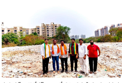
మున్సిపల్ కార్పొరేషన్ కాలంలో నిర్మించిన షాపులను ప్రస్తుతం కూడా క్యాన్సిల్ రాజీయ్ నాయకులు అడ్డెలకు ఇచ్చుకుంటున్నారు, దీనిపై రెవెన్యూ అధికారులు చర్యలు తీసుకోవడం లేదని విమర్శించారు. ఈ భూముల్లో మినీ స్టేడియం, 100 పడకల ఆసుపత్రి నిర్మాణం చేపట్టాలని ఇప్పటికే జిల్లా కలెక్టర్ కు, మల్యాజ్ గిరి ఎంపీ ఈటెల రాజేందర్ కు వినవినత్రాలు సమర్పించామని తెలిపారు. అవసరమైతే ఎంపీని స్వయంగా ప్రదేశానికి తీసుకువచ్చి అభివృద్ధి పనులు ప్రారంభించేలా చర్యలు తీసుకుంటామని అన్నారు.