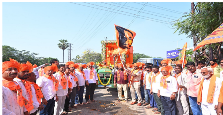
చౌటుప్పల్, ఏప్రిల్ 02, (వార్తా పత్రిక) : చౌటుప్పల్ మండలం పంతుంగి గ్రామంలో హనుమాన్ జయంతి సందర్భంగా హనుమాన్ దేవాలయంలో హనుమాన్ కి ప్రత్యేకంగా అభిషేకాలు చేయడం జరిగినది ఆనంతరం హను మాన్ రావలి చౌటుప్పల్ సిబ్బ మన్నధ కుమార్ జండా ఊపి రావలి ప్రారంభోత్సవం చేశారు. శాహయ వస్త్రాలతో భక్తులు, జై హనుమాన్ నినాదాలతో, అటవీలతో గ్రామ రోడ్డు నుంచి భారీ సభ్యులతో ఉరి వివరి వరకు రావలి తీశారు. ఈ రావలి గ్రామ పెద్దలు హనుమాన్ భక్తులు గ్రామ ప్రజలు పాల్గొన్నారు హనుమాన్ జయంతి గ్రామము పురపాలక గుండా భారీ ఎత్తున ప్రజలు పాల్గొని విజయవంతం చేశారు