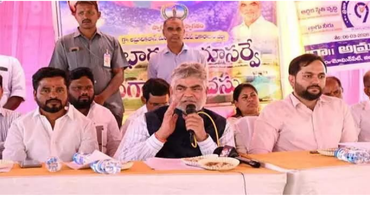
ముఖ్యమంత్రి రేవంత్ రెడ్డి

చరిత్ర పత్రీకరణలతో తన లోపలి వికృతత్వాన్ని బయట పెట్టుకున్నాడు తెలంగాణ ఉద్యమంలో రాజీనామా చేయక వెన్నుచూపి పారిపోయాడు నేడు పార్లమెంట్ సాక్షిగా మరోసారి ద్రోహానికి పాల్పడ్డాడు ఏడు మండలాలనే విభజన చట్టంలో ఉదాహరణగా చూపడం వారితో అవాస్తవం