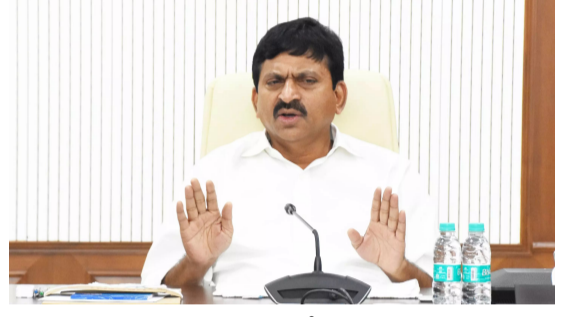
హైదరాబాద్, ఏప్రిల్ 1 : తెలంగాణలో భూ వివాదాలకు ప్రభుత్వం చెక్ పెట్టనుంది. ఏప్రిల్ 2 నుంచి రాష్ట్ర వ్యాప్తంగా భూభారతి సేవలు అమలు చేయనుంది. ప్రయోగాత్మకంగా 5

• ఐదు మండలాల్లో ప్రయోగాత్మకం • అధికారులతో సమాక్షించిన మంత్రి పాంగులేటి