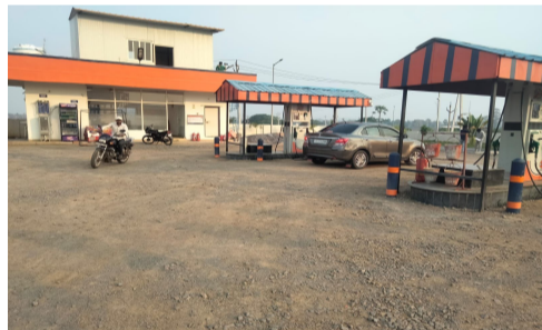
జాతరకు వచ్చే భక్తులకు ఉద్యోగస్థులకు వాహనాదారులకు పెట్రోల్ బంకు వద్ద చాలా లోటుగా ఓపెన్ చేస్తున్నారు ఎందుకు అలస్యాంగా ఓపెన్ చేస్తున్నారు అని అడుగుతే

సమాధానము లేదు అహంకారంగా ఉంటున్నా నిత్యం భక్తులు రోజు పస్తూ పోతూ ఉంటున్నా భక్తులకు పెట్రోల్ లేక ఇబ్బంది పడుతున్నా టూ వీలర్స్ లారీలు ఆటోలు జీపులు టూలు మ్యూజిక్కులు చాలా వాహనాదారులు ఇబ్బందులు పడుతున్నా పెట్రోల్ గురించి వివిధ రకాలూ ఆరోపణలు వస్తున్నాయి స్థానికంగా ఉండే ప్రజలు ఉదయం డ్యూటీకి పోయే వాళ్ళకు పెట్రోల్ లేక ఇబ్బంది పడుతున్నా లోకల్ ప్రజలు పెట్రోల్ లేక ఇబ్బంది పడుతున్నా పెట్రోల్ బంకు వద్ద ఉన్న గ్రామాల తాడ్యాయి పెట్రోల్ బంకు గాని పసర పెట్రోల్ బంకు గాని గోవిందరావుపేట పెట్రోల్ బంకు గాని పోయి పెట్రోల్ కొరక పోయి పట్టుకుని వస్తున్నా ప్రజలకు తప్పని బాధలు ఇది నిజం స్థానిక ప్రజలు జాతరకు వచ్చే భక్తులు ఆరోపణలు చేస్తున్నా