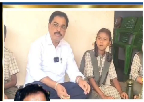
తీసుకువచ్చారు..అనంతరం ప్రతి గదిని, వంటకు వాడే బియ్యం,

- అనంతరం విద్యార్థులతో కలిసి భోజనం చేసి, విద్యార్థులకు యోగ మ్యూట్లు అందజేశే