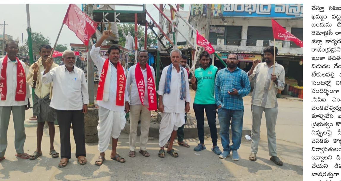
వార్తాపత్రిక: బేకులపల్లి, మార్చి 22: ఖమ్మం ప్రాంతంలోని నేపథ్యంలో వారందరికీ ఇంటి స్థలాలతో పాటు ఇందిరమ్మ ఇల్లు వెలుగుమట్ల గ్రామంలో ప్రభుత్వం పేదల ఇళ్లను కూల్చివేసిన ఇవాసలని హైకోర్టు ఆదేశాలను అమలు చేయాలని డిమాండ్