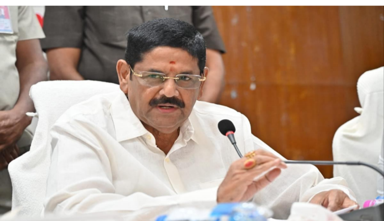
ఆగ్రహించారు. జుబుదిపై ఫిషింగ్ హాస్టల్లో మంచి పరిశ్రమ వస్తే, కావాలనే వైసీపీ నేతలు ఆరోపణలు చేస్తున్నారని దుయ్యబడ్డారు. మంత్రి నారా లోకేశ్ పై కావాలనే జగన్ అండ్ కో

నెల్లూరు, మార్చి 22: వైసీపీ అధినేత వైఎస్ జగన్ మోహన్ రెడ్డిపై ( ఏపీ మంత్రి ఆనంద్ రామనారాయణ రెడ్డి తీవ్ర ఆగ్రహం వ్యక్తం చేశారు. రాష్ట్రాన్ని వైసీపీ రూ.10 లక్షల కోట్ల అప్పుల్లో ముంచి వెళ్లిపోయిందని ధ్వజమెత్తారు. అభివృద్ధిలో కూటమి ప్రభుత్వం ఎక్కడా రాజీపడకుండా ముందుకెళ్తుందని చెప్పుకొచ్చారు. (ఆదివారం) నెల్లూరు జిల్లాలో పర్యటిస్తూ, పలు కార్యక్రమాలలో మంత్రి ఆనంద్ రామనారాయణ రెడ్డి పాల్గొన్నారు. ఈ సందర్భంగా ఆయన మీడియాతో మాట్లాడారు. జగన్ హయాంలోని ఐదేళ్లలో రాజకీయాలు ఇంత ప్రకాశంతో ఉన్న పరిస్థితి లేదని తెలిపారు. త్వరలో శ్రీరామ పట్టాభిషేకం కార్యక్రమం.. తమ ప్రభుత్వానికి రెండేళ్ల సమయం కూడా పూర్తి కాకుండానే వైసీపీ నేతలు తమపై మాటల దాడులు చేస్తున్నారని మంత్రి ఆనంద్ రామనారాయణ రెడ్డి