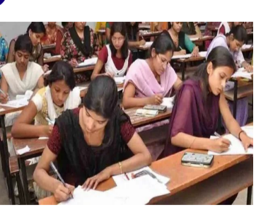
రాసిన సమాధానాల ఆధారంగానే మూల్యాంకనం చేయాలని సూచించింది. జవాబు పత్రాలలోని సమాధానాలు పూర్తిగా చదవకుండా మార్కులు ఇవ్వవద్దంది. మూల్యాంకనం పూర్తయిన తర్వాత మూల్యాంకనం చేసిన వారు పాఠశాలకు వేయాలని సూచించింది. ఈ మూల్యాంకనంలో పాఠశాలకు చేసే భారీగా జరిమానాలు ఉంటాయని హెచ్చరించింది. పేపరు మూల్యాంకనం చేసిన వారు పాఠశాలకు చేస్తే.. రూ. 3 వేలు నుంచి రూ. 7,500 వరకూ, ఎవారికి రూ. 2 వేలు నుంచి రూ. 3,750 వరకూ జరిమానాలు విధిస్తామని తెలిపింది. మార్కుల్లో భారీ వ్యత్యాసం వస్తే మూల్యాంకనం నుంచి డీకార్ చేస్తామని ఇంటర్మీడియట్ బోర్డు ఉన్నతాధికారులు హెచ్చరించారు.