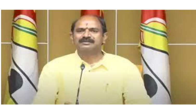
తారు. జగన్ బాబాయ్, మాజీ మంత్రి వివేకానందరెడ్డిని హత్య చేసి గుండెపోటు, ఆ తర్వాత నారాసర రక్త చరిత్ర అంటూ విష ప్రచారం చేశారని తీవ్ర ఆగ్రహం వ్యక్తం చేశారు. రాష్ట్ర ఆడబిడ్డగా ఎవరికైనా అన్యాయం జరిగితే అదిగా నిలిచే బాధ్యత తమ ప్రభుత్వానిదని చెప్పుకొచ్చారు. అది విజయమృత్యు అయినా మరే ఇతర మహిళ అయినా న్యాయం కావాలంటే అందగా నిలబడతామని స్పష్టం చేశారు. పాదయాత్రలో జగన్ ఇచ్చిన ప్రతి మాట మోసమని ఐదేళ్ల పాలనలో చూశామని అన్నారు. ఐదేళ్ల పాలనలో జగన్ చెప్పిందంతా అడ్డం, చేసి