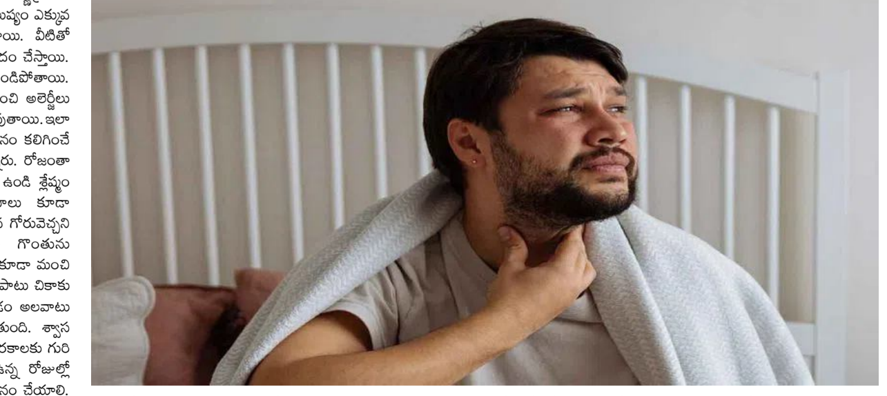
మానుకోవాలి. 2 వారాలకు మించితే.. అల్లర్ల లేదా సీజనల్ పొడిదనం వల్ల వచ్చే గొంతు సమస్యలు కొన్ని

ప్రేరిపించబడతాయి. అలాగే వసంత కాలంలో ఉష్ణోగ్రతలు మారుతుంటాయి. పొడి గాలులు, ధూళి పెరుగుతాయి. కాలుష్యం ఎక్కువ అవుతుంది. ఇవి గొంతు ఎండిపోవడానికి కారణమవుతాయి. వీటితో పాటు ఇండోర్ వాతావరణాలు కూడా ఈ సమస్యకు దోహదం చేస్తాయి. రాజ గదుల్లో తేమ తగ్గిపోవడం వల్ల గొంతు, ముక్కు ఎండిపోతాయి. ఇండోర్ పొడి గాలి శ్వాసకోశ మార్గానికి చికాకును కలిగించి అల్లర్లు ఉన్న వారిలో లక్షణాలు మరింత తీవ్రతరం అవుతాయి. ఇలా చేయండి. పొడిగొంతు సమస్యతో బాధపడే వారికి ఉపచరణం కలిగించే కొన్ని సులభమైన నివారణలు కూడా వైద్యులు సూచిస్తున్నారు. రోజంతా ఎక్కువ నీరు తాగండి. నీరు తాగడం వల్ల గొంతు తడిగా ఉండి శ్లేష్మం పలుచన అవుతూనే సహాయపడుతుంది. వేడి ద్రవాలు కూడా ఉపచరణాన్ని కలిగిస్తాయి. హెర్బల్ టీ, సూప్, తేనె కలిపిన గోబుచెచ్చని నీరు వంటి ద్రవాలు చికాకును తగ్గిస్తాయి. ఇవి గొంతును సాంత్వనపరుస్తాయి. అలాగే ఉప్పునీటితో గార్గిల్ చేయడం కూడా మంచి ఫలితాన్ని ఇస్తుంది. ఇలా చేయడం వల్ల గొంతులో వాపుతో పాటు చికాకు కూడా తగ్గుతుంది. వీటితో పాటు హ్యూమిడిఫైయర్ వాడడం అలవాటు చేసుకోవాలి. దీనిని వాడడం వల్ల గదిలో తేమ పెరుగుతుంది. శ్వాస తీసుకోవడం సులభం అవుతుంది. ఇవే కాకుండా అల్లర్ల కారకాలకు గురి కావడాన్ని కూడా తగ్గించుకోవాలి. పుప్పొడి ఎక్కువగా ఉన్న రోజుల్లో కిటికీలు మూసి ఉంచుకోవాలి. బయట నుంచి వచ్చిన ముత్యం చేయాలి. అవసరమైతే ఎయిర్ ప్యూరిఫైయర్ ను వాడాలి. అలాగే చికాకు కలిగించే వాటిని నివారించాలి. పొగ త్రాగడం, ఎక్కువగా కాఫీ తాగడం