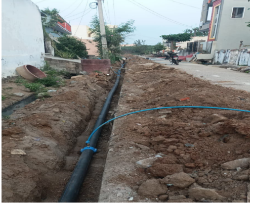
చేయించి, నూతన పైప్లైన్ పనులకు శ్రీకారం చుట్టారు. అవార్కిలను శ్రమించిన ప్రజాప్రతినిధులు పైప్లైన్ పనులు